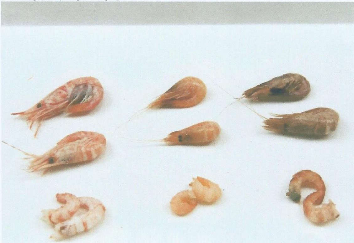
Foto: Van links naar rechts: Ringsprietgarnaal ( Pandalus montagui ), Groefstaartgarnaal ( Crangon allmani ) en Noordzeegarnaal ( Crangon crangon )